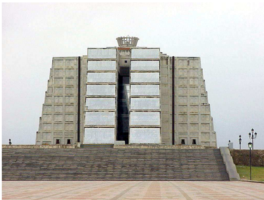
Mauzoleum Krzysztofa Kolumba w Santo Domingo na Hiszpanii

daleko, równie piękne, choć najczęściej zupełnie odmienne od tej, którą mam przed sobą. Trochę mnie rozpraszała, ale po kolejnym łyku wina i wyraźnym wyczekiwaniu przyjaciółki na moją kontynuację, wznowiłem opowieść.