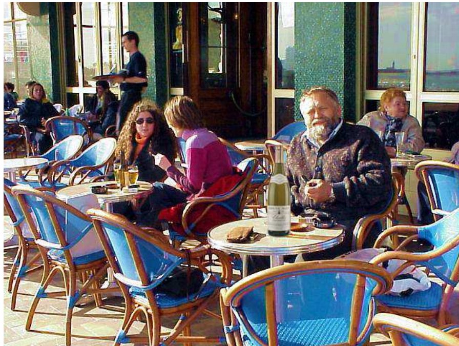
Kapitan LOBO w Les Sables d'Olone

Uśmiechnąłem się do swoich myśli, ale nie oponowałem. Czasu miałem sporo, pora i miejsce też były sympatyczne na takie spotkanie. Siedzieliśmy nieco na uboczu, w rogu tarasu i w naszej rozmowie nikt nam nie przeszkadzał. Było bezwietrznie i ciepło. Słońce dotykało już widnokregu i zapalały się pierwsze światła. Na pobliskiej plaży, na którą mogliśmy spoglądać, ostatni plażowicze zwijali swoje kocyki. Choć to daleko, pomyślałem o Karaibach, na których byłem nie tak dawno.