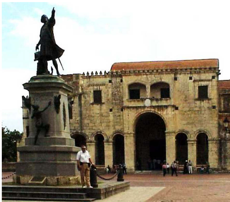
Pomnik Krzysztofa Kolumba i pierwsza katedra w Nowym Świecie w Santo Domingo na Hispanioli

Chyba najważniejszym zabytkiem w Santo Domingo dla chrześcijan jest katedra – pierwsza wybudowana świątynia w Nowym Świecie. Budowla robi wrażenie i naprawdę jest piękna w swej prostocie, surowości i doskonałości.