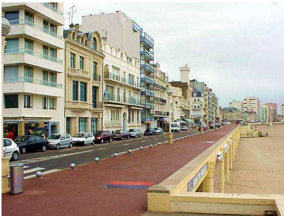
Les Sables d’Olone - Bulwar

– Dawno nie byłeś w tym porcie – stwierdziła udając, że nie usłyszała mojego wyrzutu, próbując przy tym opanować choć trochę przyspieszony oddech.